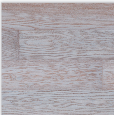
Baltic Wood, Life – The Miracles Collection. Wzór: pełna deska. Konstrukcja: podłoga trójwarstwowa. Dostępne wymiary deski [mm]: 2200/178/14. Cechy: opalane twarde dębowe drewno szrotkowane; uszlachetnienie: biały olej ECO; mikrofaza na każdym z boków deski; złącze: BALTIC LOC™ 5G.