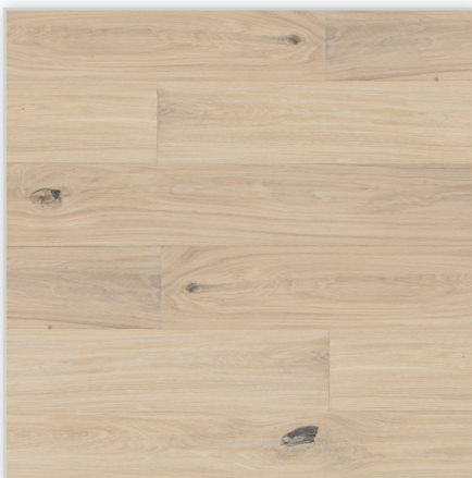
Baltic Wood, Sekrety Weroni – Timeless Collection. Wzór: pełna deska. Konstrukcja: podłoga trójwarstwowa. Dostępne wymiary deski [mm]: 2200/182/14. Cechy: ręcznie postarzana podłoga dębowa, heblowana i szrotkowana; uszlachetnienie: lekko biały ręcznie wcierany olej ECO; ręcznie wykonana faza na każdym z boków deski; złącze: bezklejowe BALTIC LOC™ 2G.