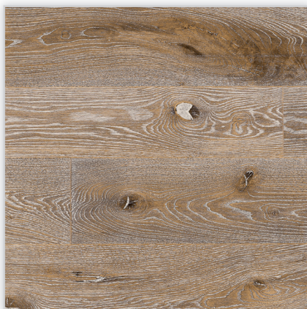
Baltic Wood, n°11 Muscat – Sélection du Sommelier. Wzór: pełna deska. Konstrukcja: podłoga lita. Dostępne wymiary deski [mm]: od 730 do 2200/145/22. Cechy: twarde dębowe drewno szrotkowane; uszlachetnienie: przecierany biały olej ECO, wgłębienia barwione na kolor brązowy; mikrofaza na każdym z boków deski; złącze: T&G.