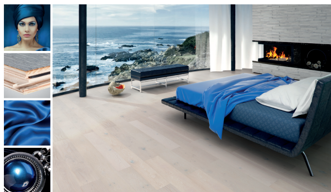
Sound z kolekcji The Miracles Collection