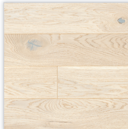
Baltic Wood, Happiness – No Limits Collection. Wzór: pełna deska. Konstrukcja: podłoga trójwarstwowa. Dostępne wymiary deski [mm]: 1090/148/14,6. Cechy: ultragruba szrotkowana warstwa dębu; uszlachetnienie: dwie warstwy kremowej bejcy i lakier matowy; mikrofaza na każdym z boków deski; złącze: T&G.