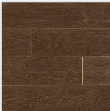
Baltic Wood, Luxury – No Limits Collection. Wzór: pełna deska. Konstrukcja: podłoga trójwarstwowa. Dostępne wymiary deski [mm]: 1090/148/14,6. Cechy: ultragruba szrotkowana warstwa dębu; uszlachetnienie: dwie warstwy brązowej bejcy i lakier matowy; mikrofaza na każdym z boków deski; złącze: T&G.