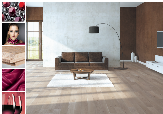
Pinot Noir z kolekcji Sélection du Sommelier

The Miracles Collection – 15 wyselekcjonowanych podłóg drewnianych we wzorze deski 1-rzędowej, których szcztokowane powierzchnie zostały uszlachetnione olejem ECO lub lakierem matowym i barwnymi bejcami. Na każdym boku deski znajduje się delikatna mikrofaza. Koncept MIX rozmiarów oferuje wiele rozwiązań ułożenia podłogi. Podłogi wyposażone są w BALTIC LOC™ 5G – najnowocześniejszy i najszybszy bezklejowy system montażu na licencji szwedzkiej firmy Välinge Innovation.