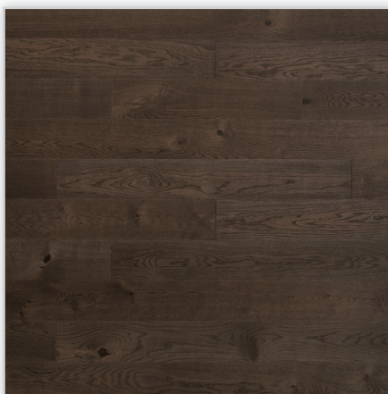
Baltic Wood, n°6 Cabernet Sauvignon – Sélection du Sommelier. Wzór: pełna deska. Konstrukcja: podłoga lita. Dostępne wymiary deski [mm]: od 730 do 2200/145/22. Cechy: twarde dębowe drewno szrotkowane; uszlachetnienie: brązowy olej ECO oraz wgłębienia barwione na kolor brązowy; mikrofaza na każdym z boków; złącze: T&G.