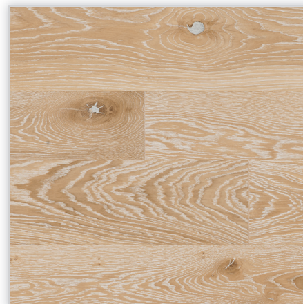
Baltic Wood, Faith – The Miracles Collection. Wzór: pełna deska. Konstrukcja: podłoga trójwarstwowa. Dostępne wymiary deski [mm]: 2200 lub 182/182/14, 2200 lub 1080/148/14. Cechy: twarde dębowe drewno szrotkowane; uszlachetnienie: kremowy olej ECO; mikrofaza na każdym z boków deski; złącze: BALTIC LOC™ 5G.