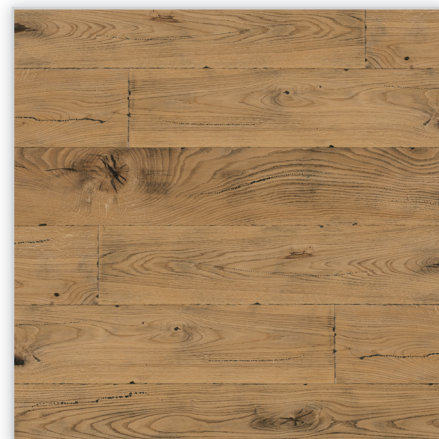
Baltic Wood, Sen Starego Malarza – Timeless Collection. Wzór: pełna deska. Konstrukcja: podłoga trójwarstwowa. Dostępne wymiary deski [mm]: 2200/182/14. Cechy: ręcznie postarzana podłoga dębowa, szrotkowana i z ostro heblowanymi na długości krawędziami; uszlachetnienie: ręcznie wcierany olej ECO, śladowo występująca czarna bejca, w tym w ręcznie preparowanych dziurach owadzych; ręcznie wykonana faza na każdym z boków deski; złącze: bezklejowe BALTIC LOC™ 2G.